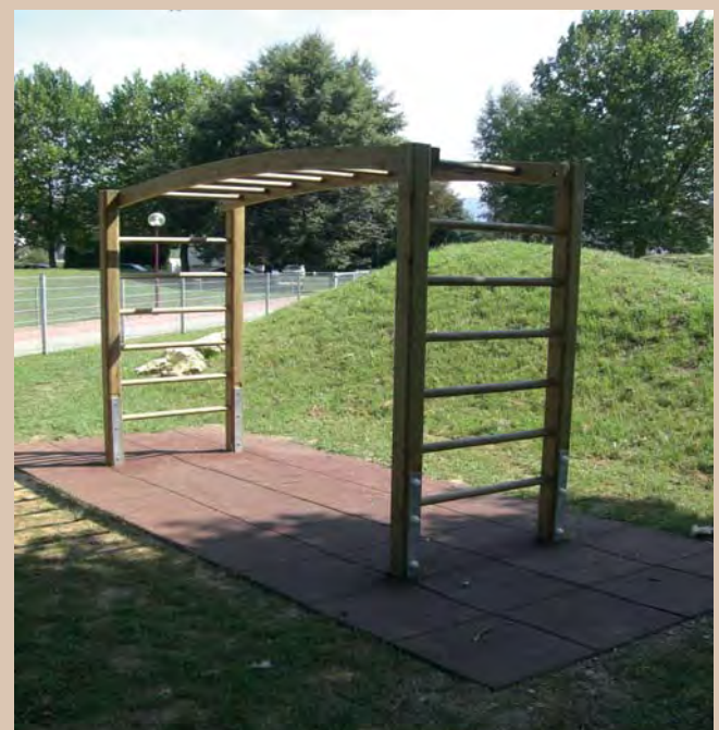
Hangelbogen mit zusätzlichen Aufstiegssprossen